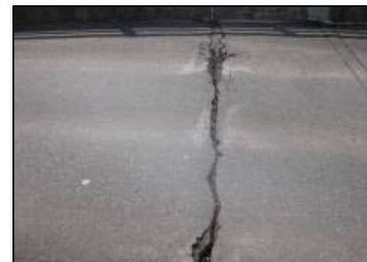
▲ 田瀬ダム 天端舗装クラック