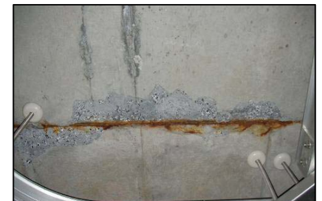
▲ 三春ダム モルタル剥離