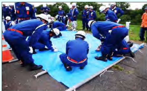
シート張り工の様子