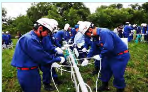
ロープワークの様子