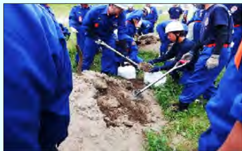
土のう作りの様子