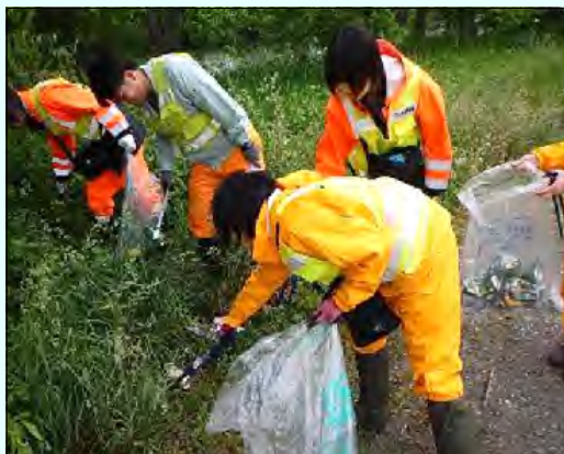
飲み終わった空き缶やペットボトルは持ち帰りましょう。