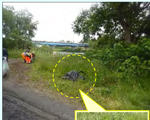
この他にも粗大ゴミ等の不法投棄が見られました。