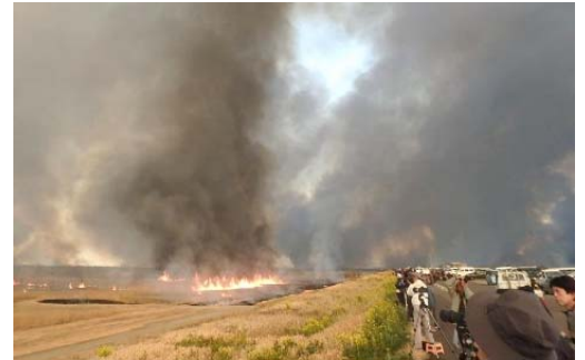
火入れの状況【イメージ】

しかし、ヨシの刈り取りや火入れが行われなくなり、ヤナギなどの侵入による環境の劣化が進み、環境の改善と保持が喫緊の課題となっています。そのため、今年が岩木川の改修100周年となることを契機に、火入れの復活に向け検討会を組織し、現地実験を行うものです。