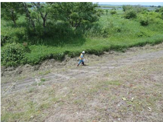
いつもゴミが多い場所ですが、この日は見 られませんでした。(富野桜つつみ公園)