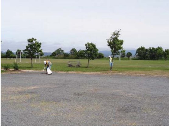
非常にきれいに管理されていました。 (つがる市河川公園)