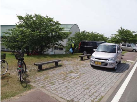
ゴミはあまり目立っていませんでした。 (鶴寿桜つつみ公園・運動場)