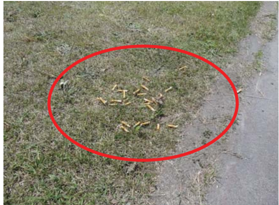
道路路肩に捨てられたタバコの吸い殻 (鶴寿桜つつみ公園・運動場)