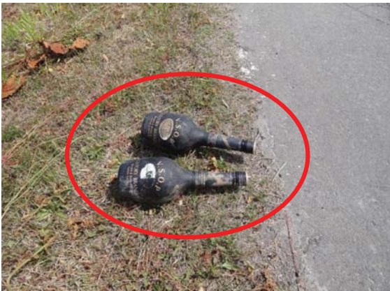
堤防法肩に放棄されたウイスキーボトル (鶴寿桜つつみ公園・運動場)