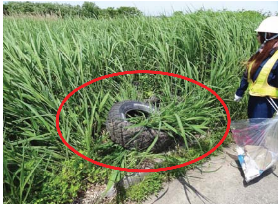
不法投棄された大型RV車用のタイヤ (五所川原市河川公園北斗グラウンド) 他にも6本あったそうです