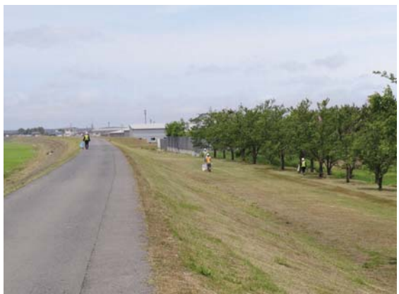
草刈後でゴミはほとんどありませんで した。