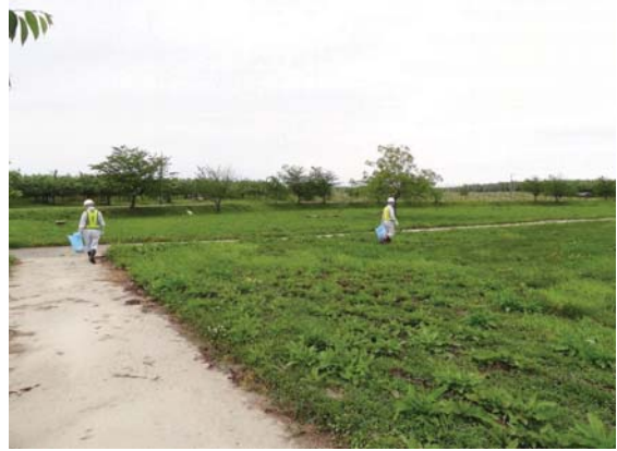
比較的きれいな状態でした。 (つがる市水辺のわんぱく広場)