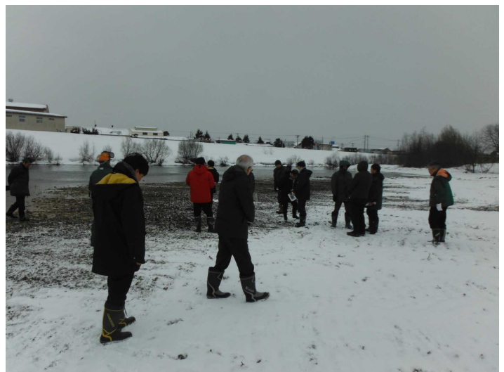
2019.2.1「岩木川魚がすみやすい川づくり検討委員会」現地視察の状況