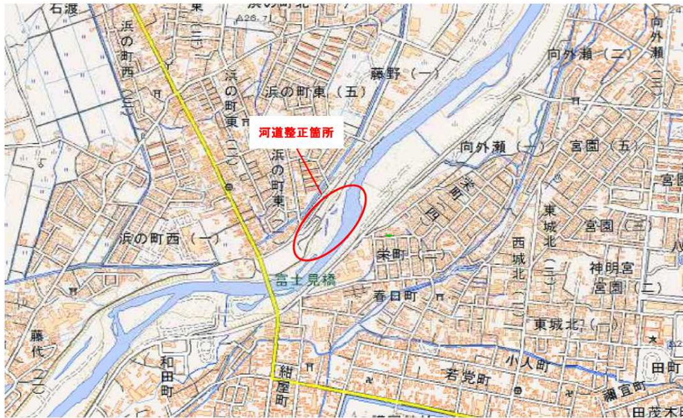
平成30年度工事箇所位置図(藤崎出張所管内)

この地図は、国土地理院長の承認を得て、同院発行の電子地形図(タイル)を複製したものである。(承認番号平30東復、第23号)