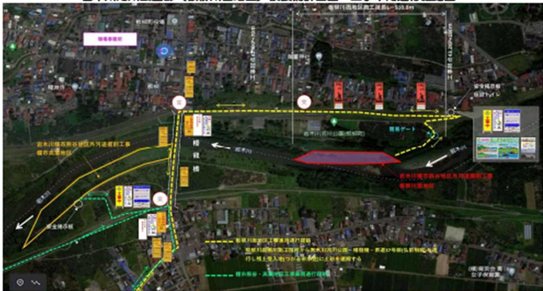
岩木川河川公園部(板柳川面地区)仮設構計画図・工事車両通行経路図