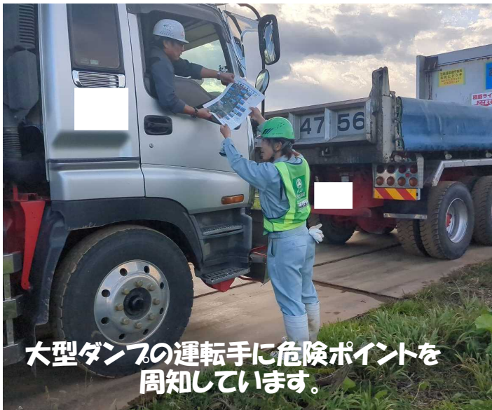
大型ダンプの運転手に危険ポイントを周知しています。

土砂運搬大型ダンプの運行安全管理として安全マップの配布と定期的に運行ルートにて注意喚起しています。