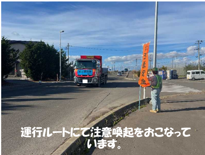
運行ルートにて注意喚起をおこなっています。