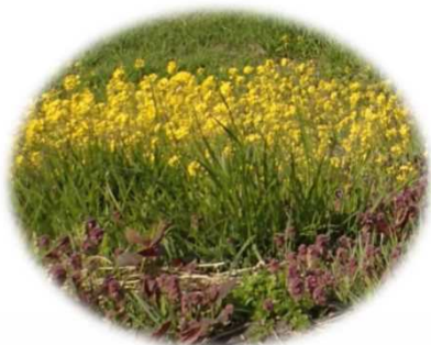
堤防付近に生えている菜の花