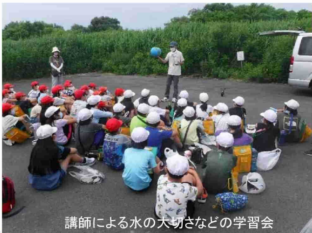
講師による水の大切さなどの学習会