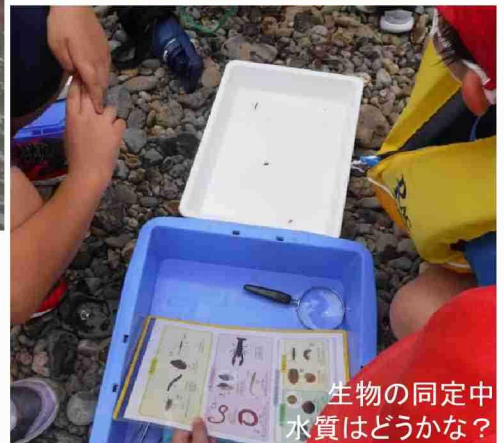
生物の同定中 水質はどうか?