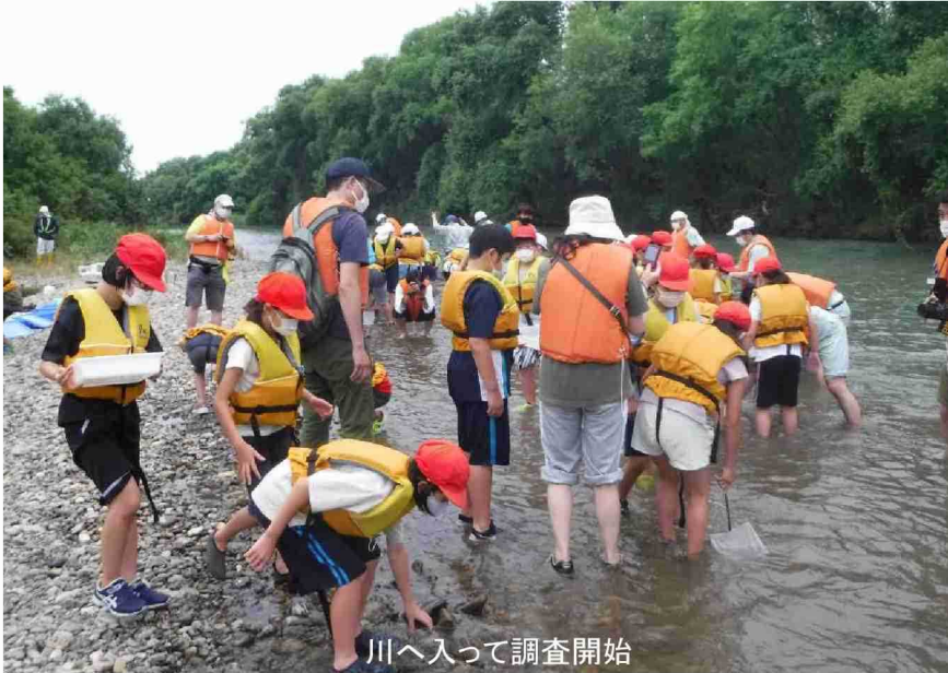
川へ入って調査開始