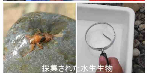
採集された水生生物