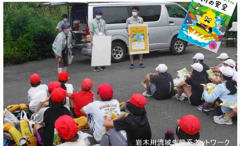
「うんこドリル川の安全」を使った学習会