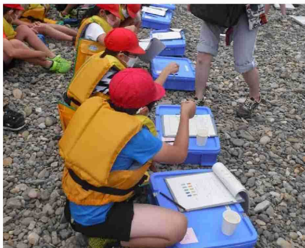
水質試験を行う児童達

また、小学校児童達には水質試験を体験してもらったり、川を安全に気をつけながら楽しく遊んでほしいと！との思いを込め学習会をおこない、知識を深めてもらいました。