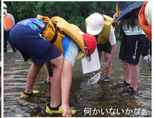
何かいないかなあ