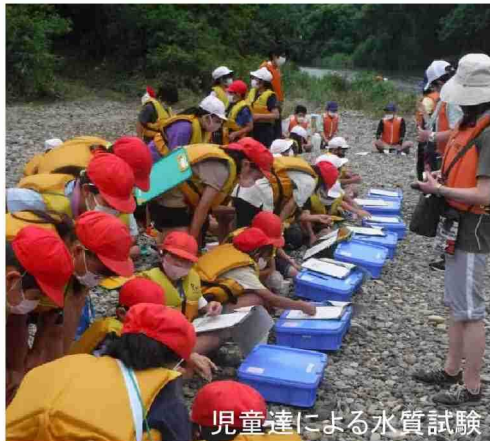
児童達による水質試験