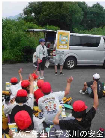
うんこ先生に学ぶ川の安全