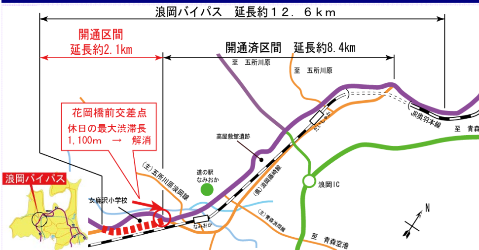
開通した浪岡バイパス