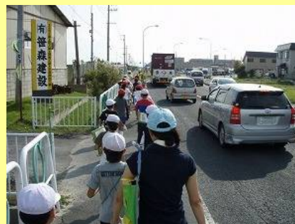
▲歩道が狭いわりに交通量が多い国道7号