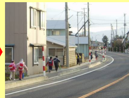
▲交通環境が改善した現国道7号