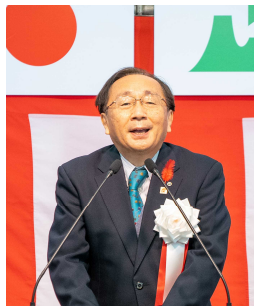
▲三村 申吾 青森県知事 挨拶