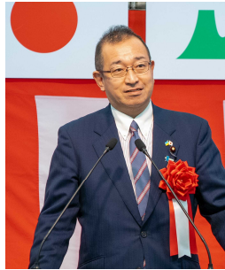
▲津島 淳 衆議院議員 祝辞