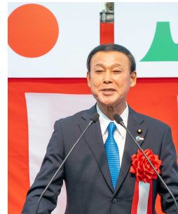
▲滝沢 求 参議院議員 祝辞