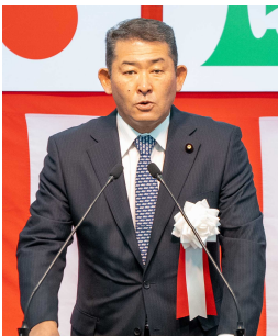
▲石井 浩郎 国土交通副大臣 挨拶