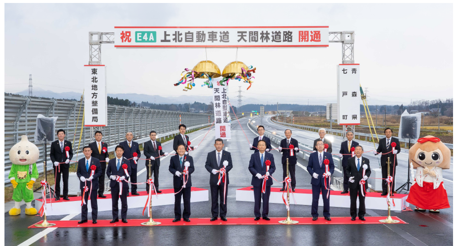
▲テープカット及びくす玉開披