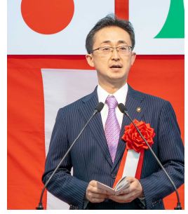
▲小野寺 晃彦 青森市長 期待の言葉