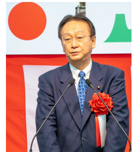
▲江渡 聡徳 衆議院議員 祝辞