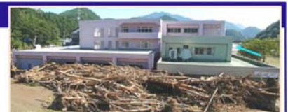
平成28年台風10号により、岩手県の要配慮者利用施設では利用者9名の全員が死亡。