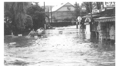
昭和50年 土淵川 (弘前市南川端町) 洪水写真

昭和50年8月には、津軽南部から十和田湖周辺にかけての集中的な降雨により県が管理する中小河川が大洪水となり、各所で決壊・溢水が発生して支川浅瀬石川、土淵川などで未曾有の激甚な大災害となった。