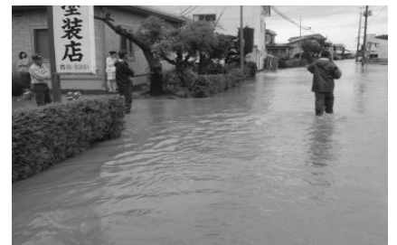
平成25年9月洪水 無堤部からの浸水した 弘前市大川地区

令和2年9月4日、台風第9号から変わった低気圧から日本海にのびる前線に向かって暖かく湿った空気が流れ込んだ影響で、4日朝から夕方にかけて大気の状態が非常に不安定となり、津軽を中心に激しい雨が降り大雨となった。特に弘前市では時間雨量88mm/hの既往最高の豪雨を記録し、市街地の一部で床上浸水17件、床下浸水28件が発生した。