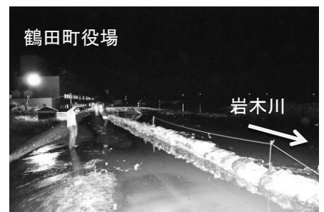
平成25年9月洪水 越水の恐れがある箇所の 水防活動 (鶴田町鶴田地先)