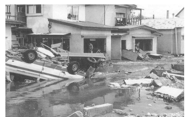
昭和52年 寺沢川 (弘前市在府町) 被災写真2

また、県管理区間では土淵川、十川などが大洪水に見舞われ、土淵川・寺沢川合わせて死者9名、全半壊85戸、床上浸水1,374戸、床下浸水1,270戸の被害が発生するなど、弘前市始めて以来の未曾有の大災害となった。