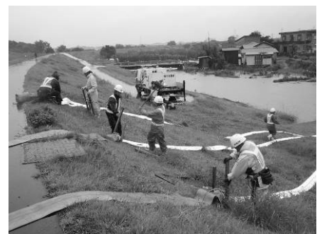
平成25年9月洪水 排水ポンプ車による排水作業 (鳴瀬排水樋管)