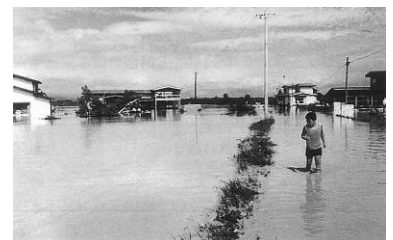
昭和52年8月洪水 後長根川から浸水した弘前 市中崎地区

昭和52年8月豪雨では、岩木川、平川、浅瀬石川などの各河川は急激に増水し各地に被害をもたらした。直轄管理区間では決壊等の直接的な被害はなかったが、岩木川では床上浸水5,612戸、床下浸水8,072戸の被害が発生するなど、支川での氾濫により多くの住宅地を含む広範囲が長期間にわたり浸水した。