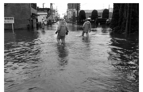
令和2年9月集中豪雨 (弘前市品川町)