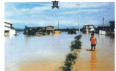
昭和52年8月洪水 後長根川から浸水した弘前 市中崎地区