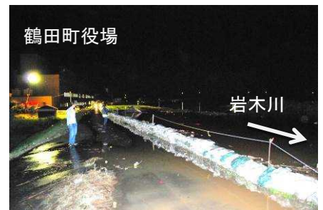
平成25年9月洪水 越水の恐れがある箇所の 水防活動 (鶴田町鶴田地先)