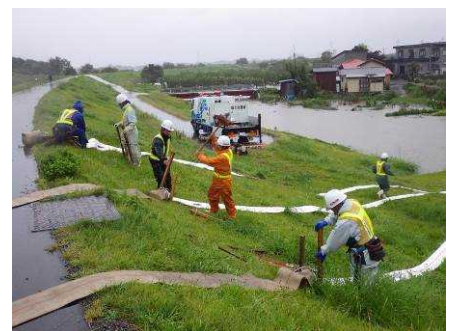
平成25年9月洪水 排水ポンプ車による排水作業 (鳴瀬排水樋管)