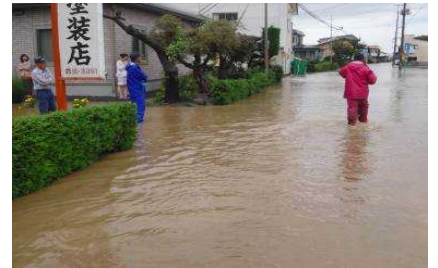
平成25年9月洪水 無堤部からの浸水した 弘前市大川地区

令和2年9月4日、台風第9号から変わった低気圧から日本海にのびる前線に向かって暖かく湿った空気が流れ込んだ影響で、4日朝から夕方にかけて大気の状態が非常に不安定となり、津軽を中心に激しい雨が降り大雨となった。特に弘前市では時間雨量88mm/hの既往最高の豪雨を記録し、市街地の一部で床上浸水17件、床下浸水28件が発生した。