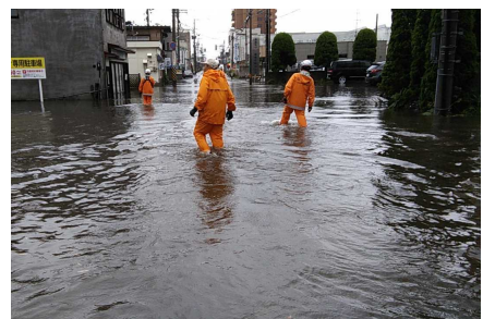
令和2年9月集中豪雨 (弘前市品川町)