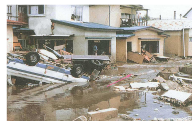
昭和52年 寺沢川 (弘前市在府町) 被災写真2