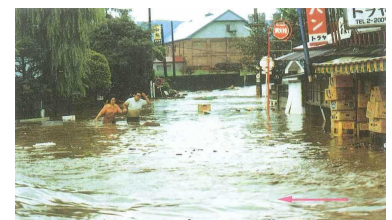
昭和50年 土淵川 (弘前市南川端町) 洪水写真