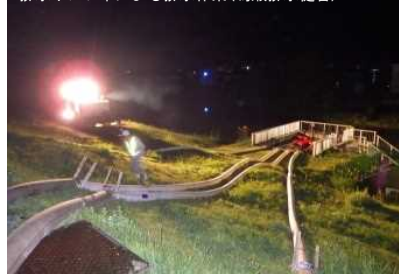
越水の恐れがある箇所の水防活動（鶴田町鶴田地先）