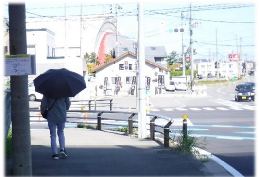
【写真①】 防護柵設置状況

青森河川国道事務所では、園児の散歩コースとなっている「運輸支局前交差点」について、交差点内のスピード抑制対策として路面標示、電光表示板による注意喚起、歩行空間の安全確保のための防護柵設置などを実施し、この度、対策が完了しました。