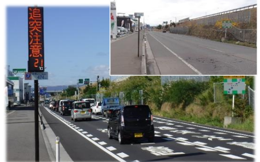
【写真②】 路面標示、電光表示板設置状況