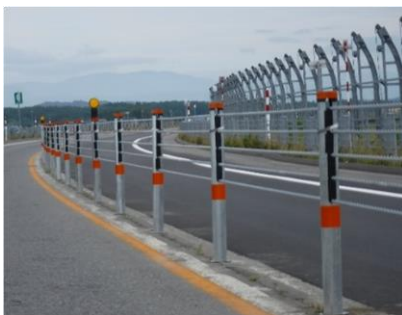
▲防護柵設置状況(カーブ区間)

また、事故原因としては「脇見運転」「前方不注意」による事故が全体の約6割を占めています。