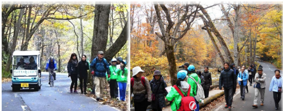
奥入瀬溪流エコロードフェスタ2016 (H28.10)の様子