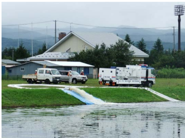
排水ポンプ車稼働訓練（青森県総合防災訓練）