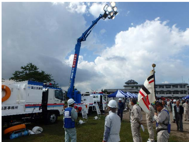
照明車の展示（五所川原市総合防災訓練）