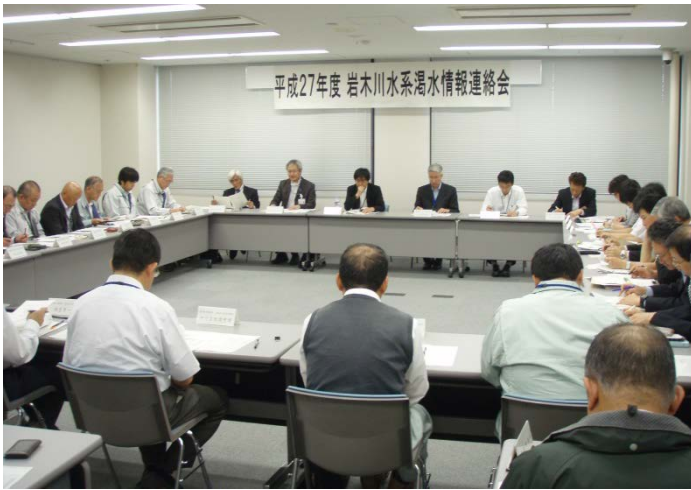
会議の様子(会場：青森河川国道事務所)

岩木川水系においては、例年に比べ、5月下旬頃から岩木川流域河川の流量が減少してきており(下表参照)、今後の気象状況によっては、利水者等への影響が生じる場合があることから6月4日(木)に河川管理者・ダム管理者・気象台・各利水者等関係機関との渇水情報連絡会を開催しました。