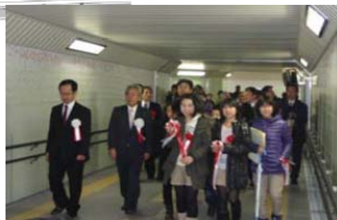
地下道の中の様子です。

青森河川国道事務所HP http://www.thr.mlit.go.jp/aomori/index.html