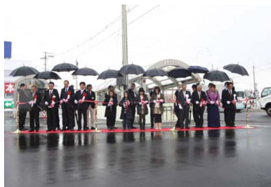
3月16日あいにくの雨の中現地にて開通式を行いました。