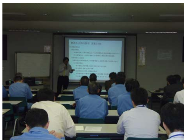
熱心に聴講していただきました