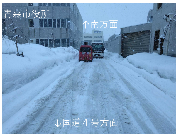
連携除雪前(市道中央線)