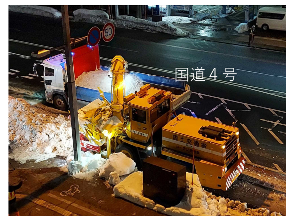
③ロータリー除雪車でダンプトラックに積み込み