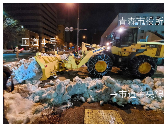
②国道4号に掃き出し