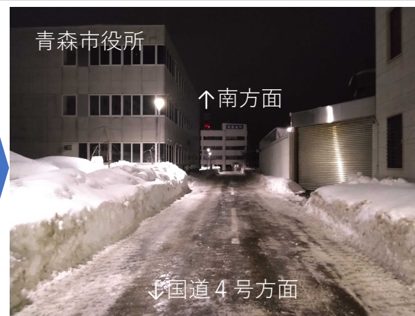
連携除雪後(市道中央線)