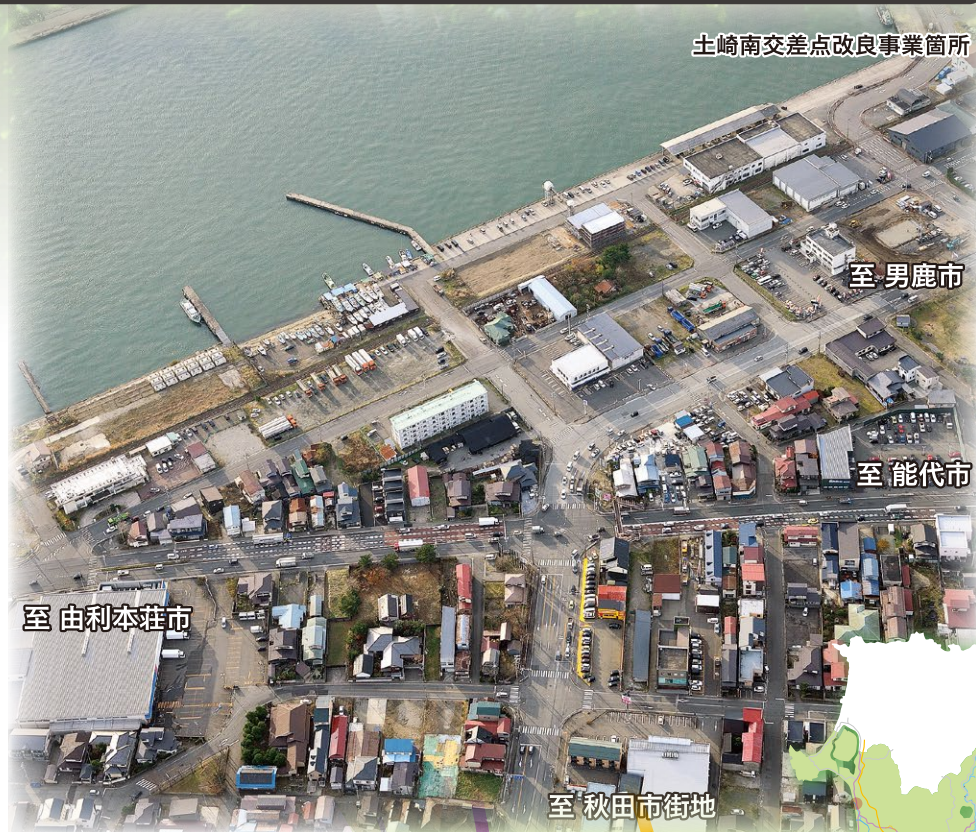
土崎南交差点改良事業箇所

現状当該交差点では、交通事故や渋滞が多発しています。本事業は、右左折レーンの設置によりこれらの問題を改善します。