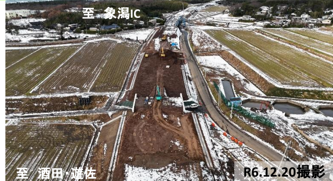
① 大砂川釜道地区道路改良工事