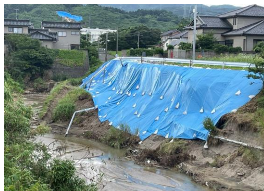
両前寺川沿いの崩落状況