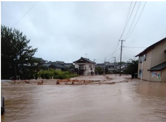
道路や住宅地が冠水