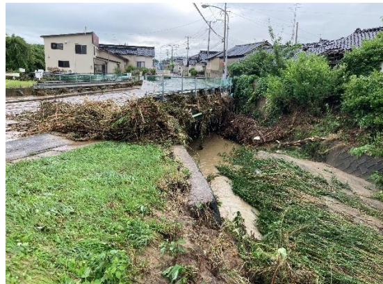
水位が下がった後の状況