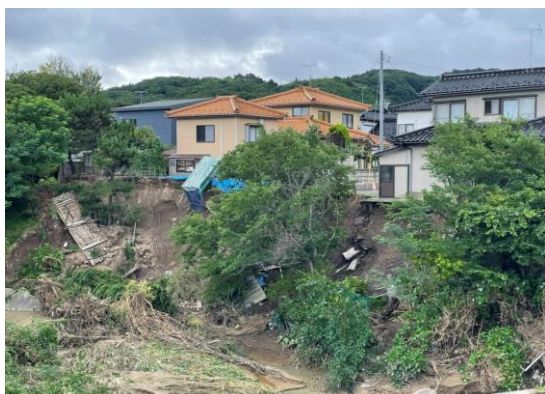
阿部堂川沿いの崩落により 住家（2棟）全壊判定