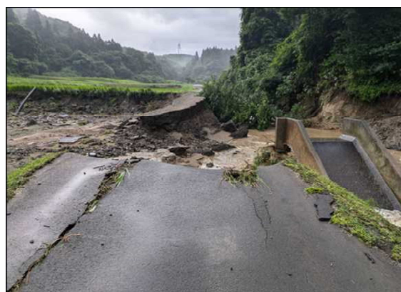
西目地域 (湯ノ沢1号線)