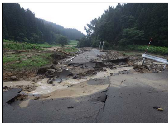
由利地域 (市道久保田大森台線)