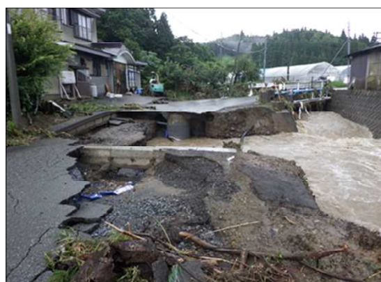
東由利地域 (市道横山線)