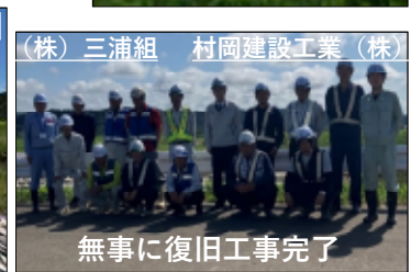
無事に復旧工事完了