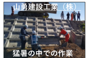
山勇建設工業（株） 猛暑の中での作業

7月24日からの記録的大雨で決壊した子吉川及び石沢川の堤防の緊急復旧工事が完了しました。猛暑の中、協力業者の皆様による昼夜を問わずの作業により、概ね1週間で堤防の緊急復旧工事が完了しました。また、 （株）大沼組 様には、被災状況を把握するための河川巡視や、堤防の崩壊を防ぐシート張り工法の実施、浸水箇所での排水ポンプ車による排水作業など、多方面でご尽力いただきました。早期の復旧に向け、迅速にご対応いただいた関係各所の皆様、大変ありがとうございました。