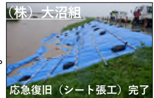
（株）大沼組 応急復旧（シート張り）完了