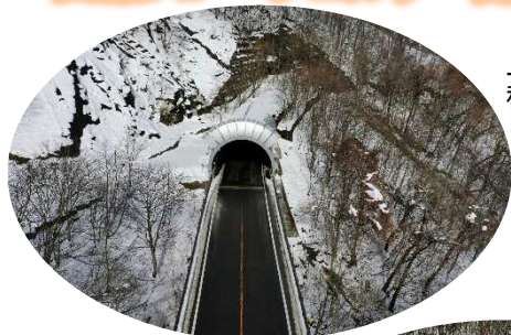
上空 正面 秋田側から撮影