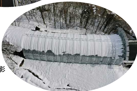
上空 側面から撮影