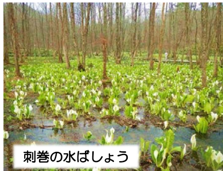
刺巻の水ばしょう