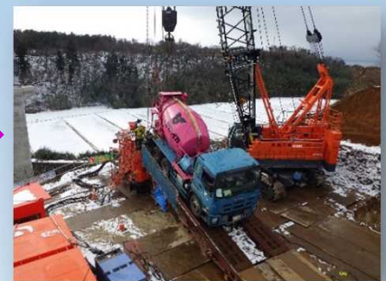
場所打ち杭とは、橋台の基礎となるもので、現場で組んだ円筒状の鉄筋を掘削した地盤の中に落とし込み、後からコンクリートを穴の中に流し込み、固めて杭を形成するものです。A2橋台では、直径2.0m・長さ31mの場所打杭6本を施工しています。