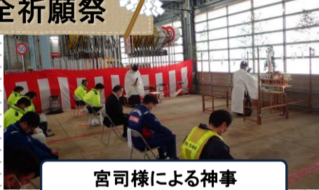
宮司様による神事