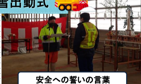
安全への誓いの言葉