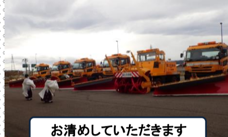
お清めしていただきます