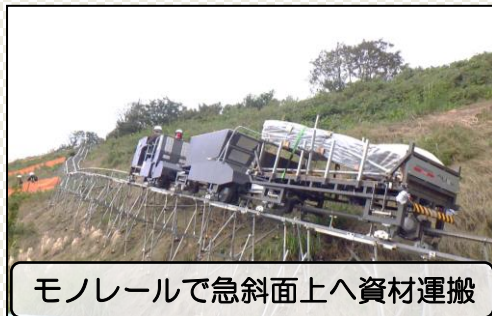
モノレールで急斜面上へ資材運搬