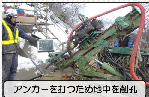
アンカーを打つため地中を削孔

【岩城地区法面防災工事】 コンクリート吹付法枠とグラウンドアンカーによる引張力で法面を安定させる工法により実施