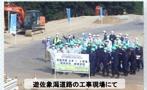
遊佐象潟道路の工事現場にて

10月9日(金) 秋田県由利地域振興局建設部と由利建設業協会の主催による現場見学・体験会が開催され、秋田県立西目高校土木系列1・2年生の生徒さんが、本荘ICステーションや遊佐象潟道路の工事現場を見学されました。この体験が、将来の進路を決めるきっかけとなればうれしいです。