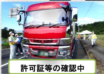
許可証等の確認中