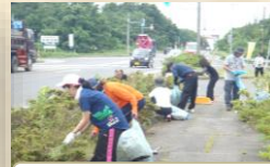
クリーンアップ活動