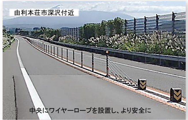
由利本荘市深沢付近