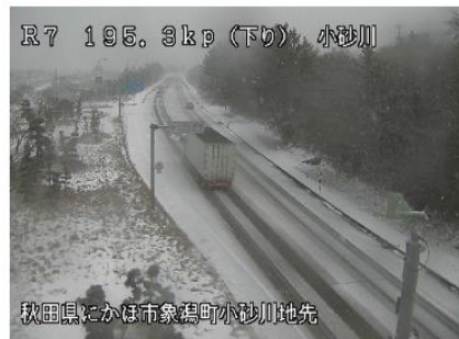
R7 195.9kp (下り) 小砂川 秋田県にかほ市象潟町小砂川地先

2019年01月09日 08:10現在の情報 気温 -0.3℃ 路面温度 0.1℃