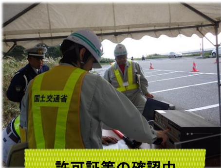
許可証等の確認中

特殊車両の通行には、道路管理者の通行許可が必要です。また、通行許可を得ている特殊車両は、許可内容を遵守して通行する必要があります。指導取締りでは、対象車両の許可証の確認や、大きさ・重さの計測などを行いました。