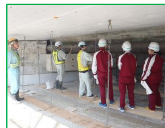
構造物修繕工事の現場 実は橋の下部にいます