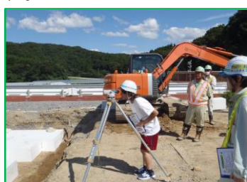
測量です！ 初めて覗いたかも