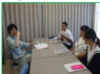
担当者から事業概要の説明を受けています

9月5日・6日の2日間、高校生(本荘高校)が当出張所において国土交通省で行う道路管理の仕事体験しました。道路行政や出張所業務の説明を受け、現在施工中の工事現場の見学や道路管理のひとつである道路パトロールを实际行い体験して仕事について学習しました。この体験で少しでも国土行政を知って頂けたら幸いです。