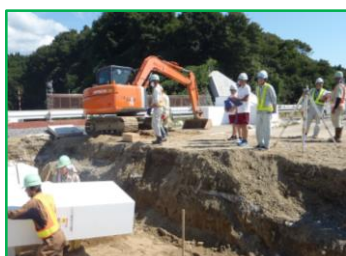
道路改良工事の現場です