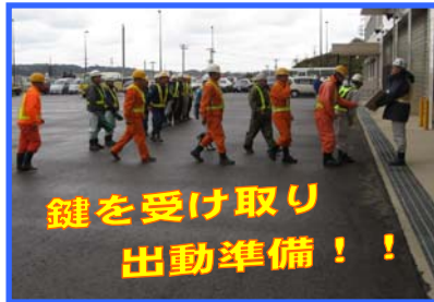
鍵を受け取り 出動準備！！