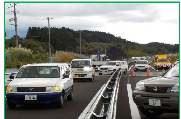
滞留車両の排除作業

日本海東北自動車道(象潟IC～金浦IC)は、片側1車線の自動車専用道路として、10月18日(日)に一般供用予定です。この区間是对向車線への飛び出し防止や規制速度向上を目的として、中央分離帯に鋼製ガードレールを設置しています。