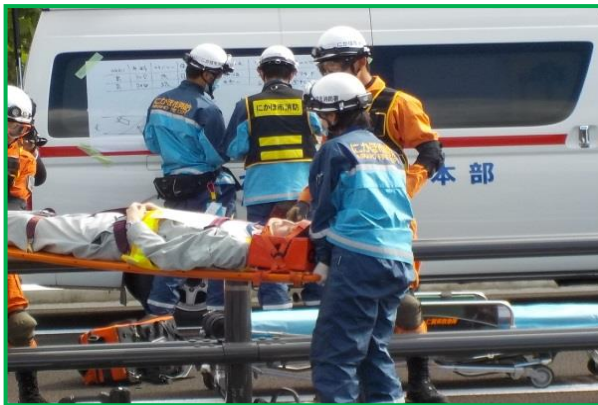
にかほ消防署による搬送作業

事故等の有事に際して、警察、消防と道路管理者(秋田河川国道事務所)の連携、および実践に向けた問題を確認しました。訓練には総勢50人が参加し、マスコミ各社の取材がありました。