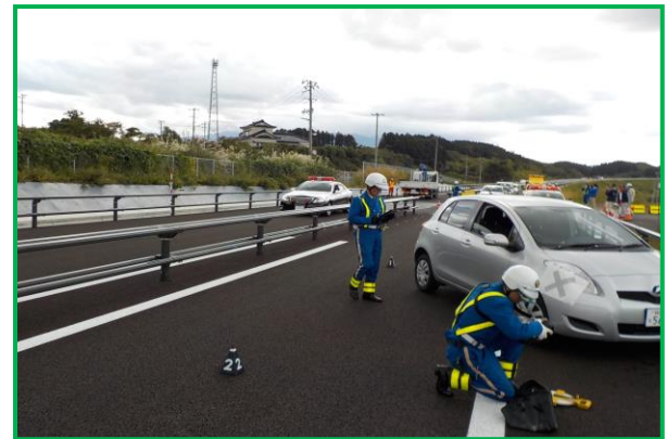
県警高速隊による事故検分