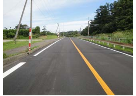
②にかほ市象潟町関地