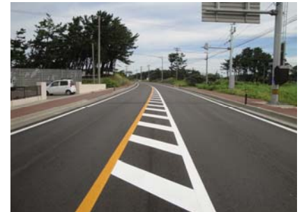
①にかほ市象潟町大塩越地内