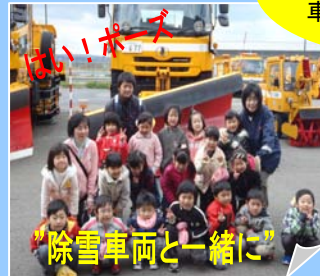
”除雪車両と一緒に”