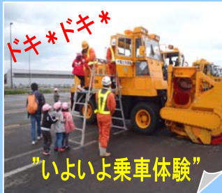
”いよいよ乗車体験”