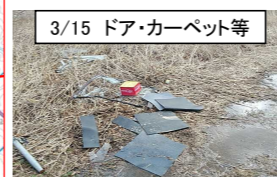
3/15 ドア・カーペット等