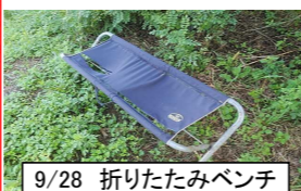
9/28 折りたたみベンチ