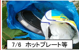
7/6 ホットプレート等