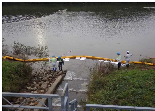
実際の油事故の様子