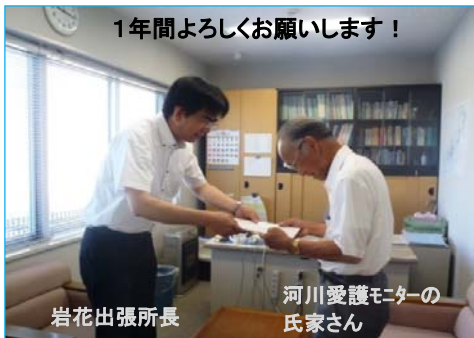
1年間よろしくお願ひします！

沿川の住民の方に河川の環境や整備についてご意見、感想などをいただくため、毎年「河川愛護モニター」を委嘱しており、今年も7月から1年間の委嘱状を交付しました。