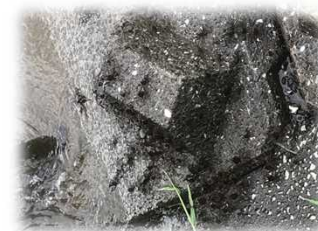
護岸を登って来ます