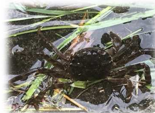
黒っぽく凸凹があります

新屋水門付近では梅雨の頃になると、たくさんの小さなカニが現れます。 『モクズガニ』とみられ、当出張所では季節の風物詩となっています。