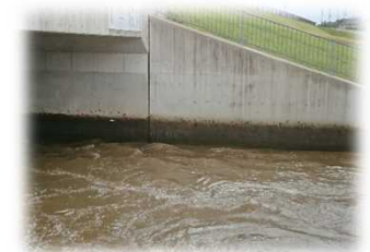
黒い点々は全部カニ