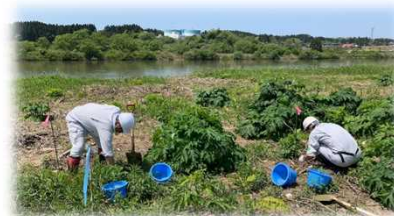
丁寧に掘り出して…