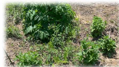
プロでないと見分けが付きません

掘削箇所で準絶滅危惧種「オオヒナノウスツボ」が見つかったため、掘削範囲外で環境が似ている位置に移植を行いました。