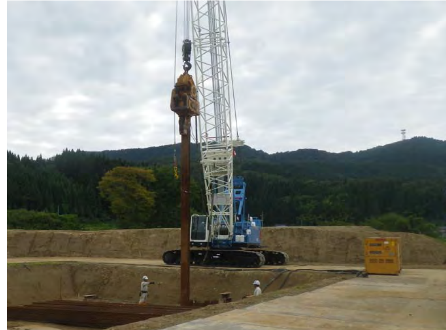
仮設矢板打込み状況