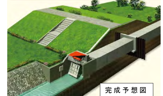
雄物川下流上田面樋門・築堤工事