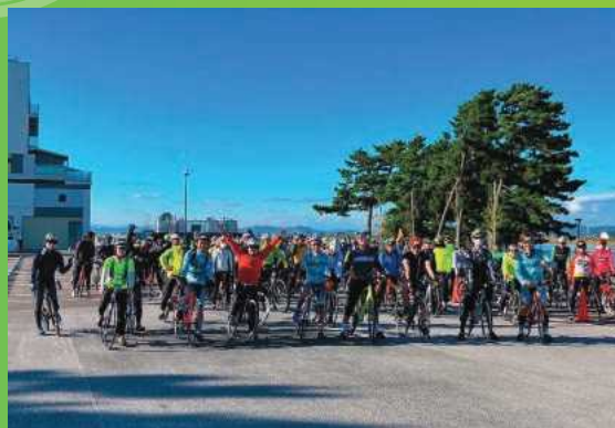
名取市：名取市サイクルスポーツセンターをスタート&amp;ゴールとした「2022 秋の100kmライドin丸森」