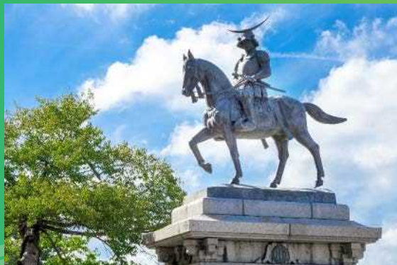
仙台市：伊達政宗公騎馬像

【会場へのアクセス】 仙台市宮東西線大町西公園駅から徒歩10分／仙台市宮南北線勾当台公園駅から徒歩10分 ※2日目の午後の会場は名取市サイクルスポーツセンター周辺