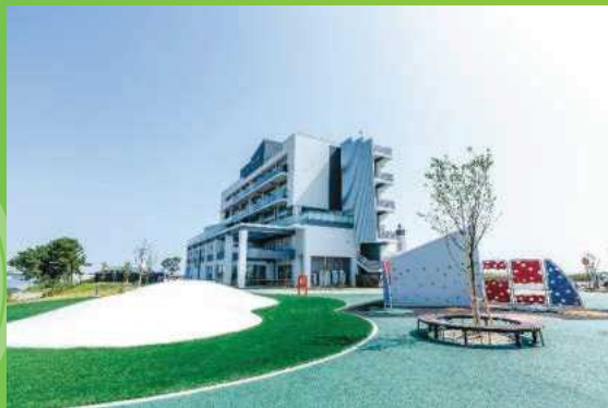
名取市：サイクルスポーツセンター