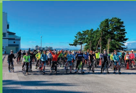
名取市：名取市サイクルスポーツセンターをスタート&amp;ゴールとした「2022 秋の100kmライドin丸森」