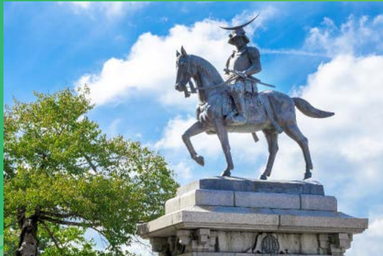
仙台市：伊達政宗公騎馬像

【会場へのアクセス】 仙台市営東西線大町西公園駅から徒歩10分／仙台市営南北線勾当台公園駅から徒歩10分 ※2日目の午後の会場は名取市サイクルスポーツセンター周辺