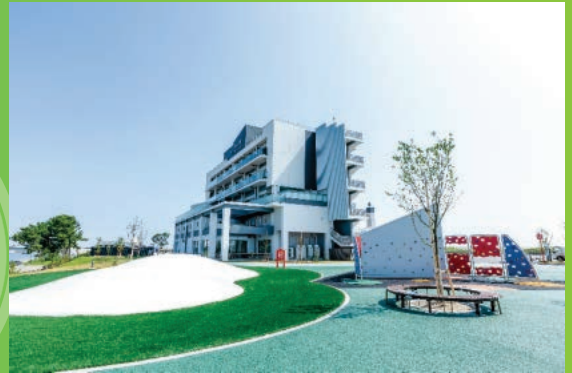
名取市：サイクルスポーツセンター